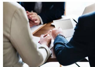
Formalización de Joint Ventures