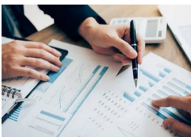
Planes Financieros a medida