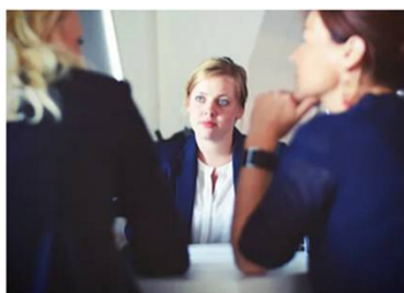
Subvenciones & Oficina técnica