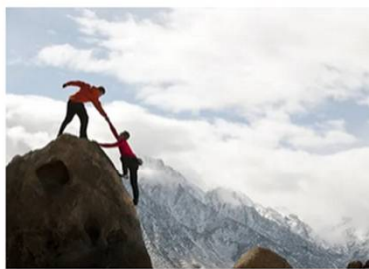
Estrategias de Scale-up