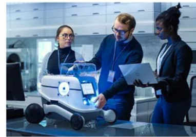
Consortios de Innovación (Cdi)