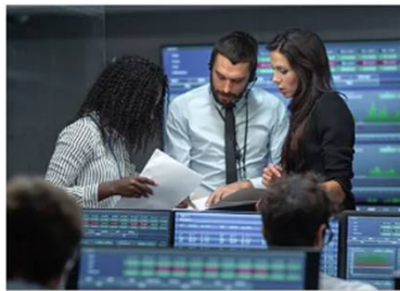
Compras externas globales (CEX)