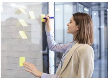
Coordinación proyectos I+D+i