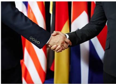
Consortios de Exportación (CdE)